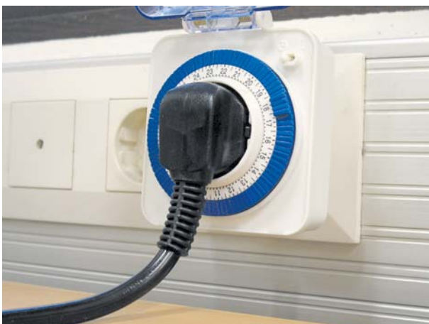
5. Reguleeri taimer