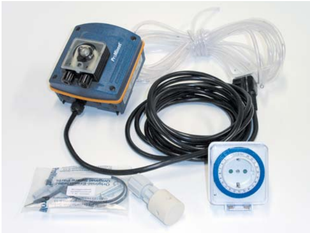
1. Pakendi sisu