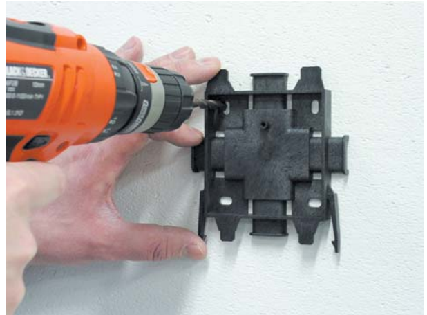
2. Kinnituspesa monteerimine