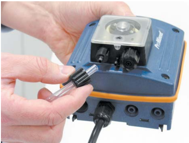
3. Voolikute kinnitus