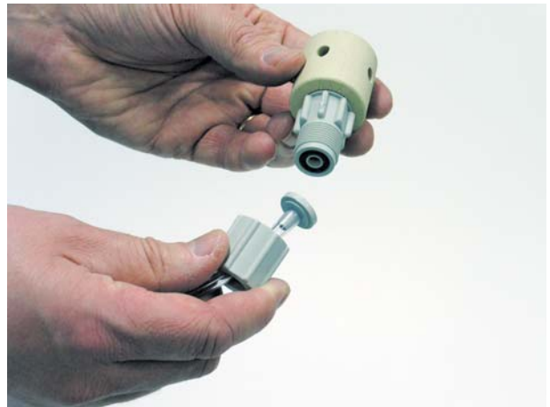
4. Filtrite monteerimine